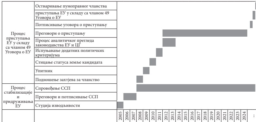
Шема бр. 2 Ходограм процеса европских интеграција Црне Горе

На бази првог процеса Црна Гора је остварила статус тзв. придруженог члана и редовно се прати спровођење права и обавеза овог процеса кроз заједничка мјешовита тијела уговорних страна, чије спровођење не води чланству (придруживање – association није пут ка чланству, али тај статус придруженог члана „престаје“ даном приступања). Истовремено, одвија се и други (преговарачки) процес, кроз званичне међувладине конференције, што подразумева постепено преузимање правне тековине ЕУ и њену досљедну примјену у земљи, што у коначници, потписивањем Уговора о приступању ( accession – приступање), води пуноправном чланству у Унији.